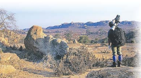
キリンはいつもこんな風景を見ているのかもしれない。バッファローの群れが見える

だが、ここはアフリカの国立公園だ。双眼鏡を覗くとキリンが立っていた。長い首はいいことばかりではない。頭を前や横に倒すのには、相当な筋力が必要になる。素早く小回りの利く動きは難しい。そうした首への負担を軽減するために、走る時には体を揺らさないような独特の走り方をする。首や胴体がほとんどブレることなく、時速60キロものスピードで走ることができる。走る姿は優雅で流れるようだ。